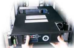
Die Schrauben links und rechts lösen und das Modul herausnehmen