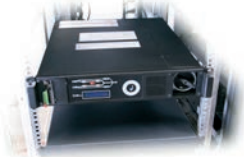
Auf manuellen Bypass umschalten, S1 oder S2