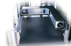
Fehlerhaftes Modul ersetzen