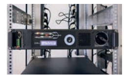
Modul festschrauben, nach dem Anlaufen manuellen Bypass zurücksetzen

Alle Vorgänge werden in der Betriebsanleitung genau beschrieben.